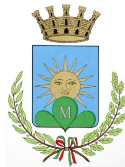
Città di Marino

ASSOCIAZIONE MUSICALE, ARTISTICA, CULTURALE " ARCO DELLA PIETA' " Via Roma n. 130 Marino (LE) CODICE FISCALE: 90033580755 E-mail: arcodellapieta_ass@libero.it