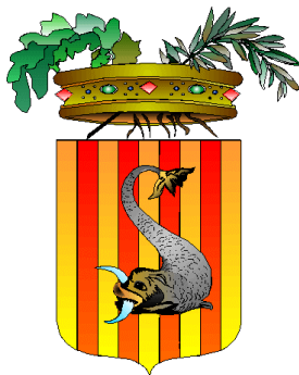
Provincia di Lecce